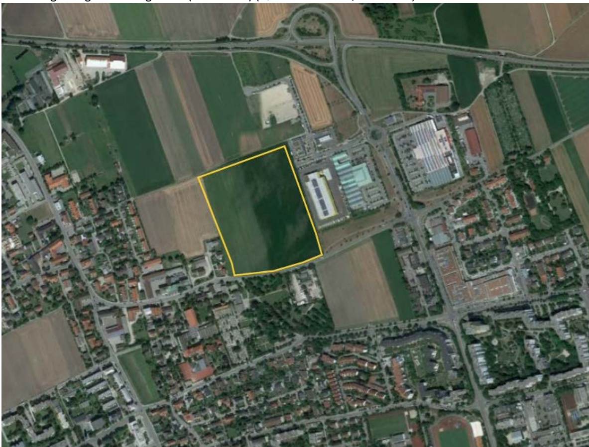
Abbildung 3: Lage des Plangebietes im Luftbild.