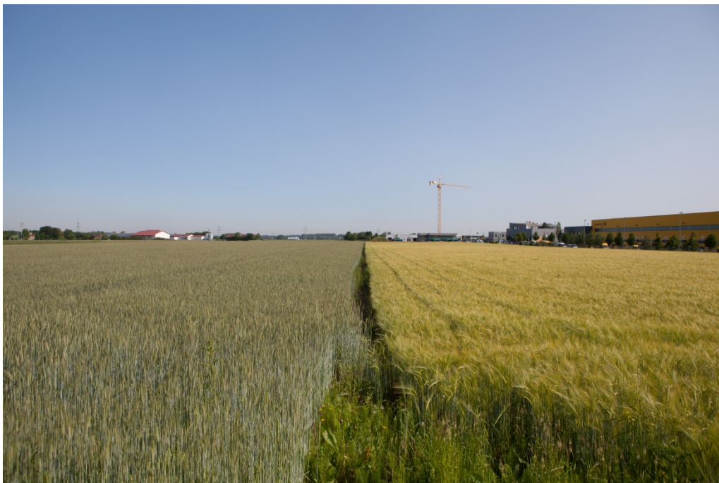
Abbildung 1: Blick auf das Plangebiet Richtung Norden.

Das Plangebiet liegt nicht im Bereich von Schutzgebieten. Im Plangebiet liegen keine Biotope der Flachlandbiotopkartierung. Die nächsten biotopkartierten Flächen befinden sich in einer Entfernung von etwa 1,8 km vom Plangebiet und sind für den Eingriff nicht relevant.